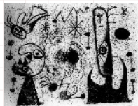
Miró, Joan. Série Barcelona XLVII. Litogravura

Gravura feita em chapa de cobre com sulcos e entalhes.