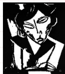
Segall, Lasar. Mulher de Braços Cruzados. Xilogravura