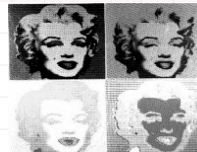
Warhol, Andy. Marilyn Monroe. Serigrafia

No séc. XX o uso da gravura foi muito difundido entre os artistas graças a sua força de expressão e diversidade que ela apresenta. Após a explicação sobre o que é gravura, apresente alguns artistas que se utilizaram dela como meio de expressão e amplie o universo expressivo dos alunos com trabalhos artísticos.