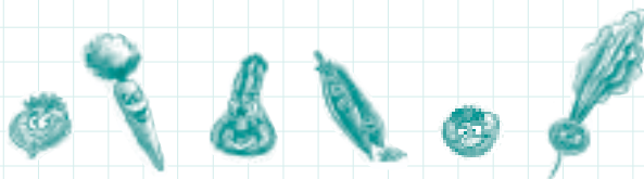
TABELA DE CULTIVO